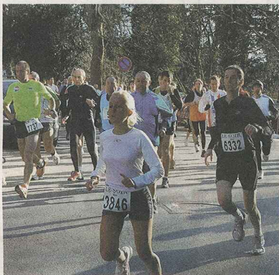
Le NAC allie la convivialité à l'effort

« La philosophie du club est avant tout de s'amuser. On est là pour entretenir notre bonne humeur. A tel point que nous n'avons rien programmé de particulier, cette année, dans